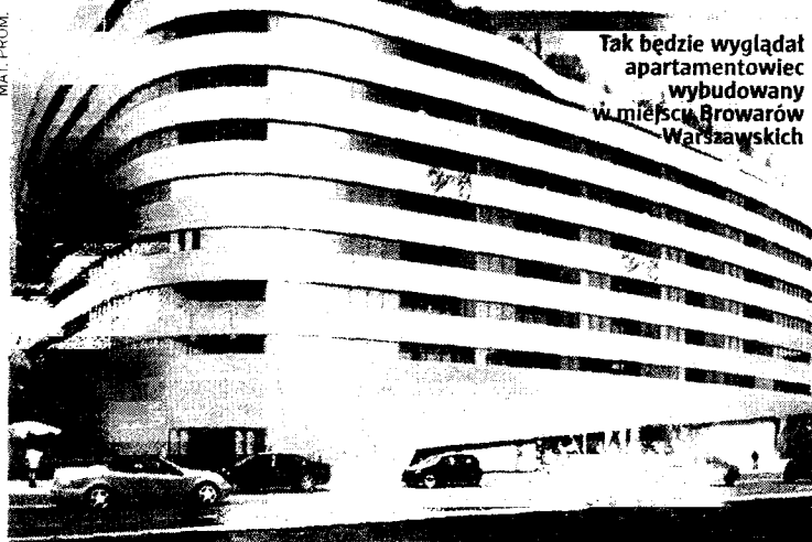
Tak będzie wyglądał apartamentowiec wybudowany w miejscu Browarów Warszawskich

Dawne Zakłady Norblina przy ul. Żelaznej 51/53 mają zachować swój historyczny charakter. Inwestor – spółka ArtNorblin, należąca do funduszy Patron Capital Partners – chce zrewitalizować zabytkowe objekty i stworzyć tu wielofunkcyjną przestrzeń z budynkami mieszkalnymi, handlowo-usługowy-