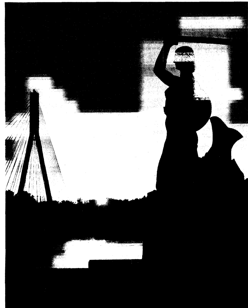
Jedną z wyróżnionych prac jest zdjęcie Roberta Jankowskiego pt. „Wisła, harmonia piękna”