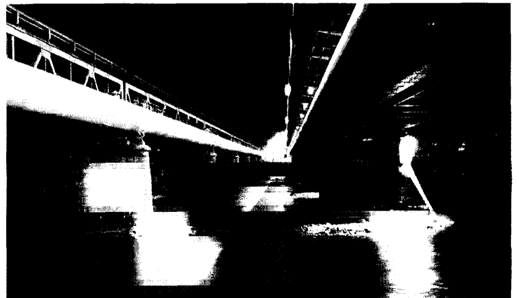
Trzecie miejsce zajęła praca Łukasza Łuka – „Mosty”