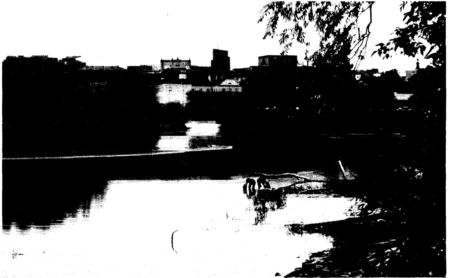
Pierwsza nagroda w naszym konkursie – „Zintegrowana rzeka”.

Na początku przyszłego tygodnia 10 wyróżnionych prac będzie można oglądać na wystawie plenerowej przy ulicy Lipowej, obok biblioteki uniwersyteckiej. Stąd już tylko kilka metrów do Wisły. Może więc warto wybrać się na spacer nad rzekę? Koniecznie z aparatem.